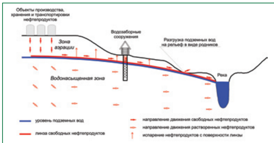
Рис. 1. Схема формирования и распространения загрязнения нефтепродуктами